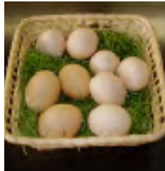
鳥骨鶏の卵も販売しています。

おおやまみち事業特集の第3弾、自然食品事業の特集です。事業の内容は主に、野菜・植物の栽培・販売と畑の中にある、梅の木の剪定・消毒畑の整備（草むしり・耕耘作業）ウコッケイの世話と市役所出店等に出す加工品（梅ジャム・生姜の佃煮）作り、ブルーベリー