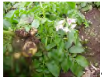
例年に比べ小さめ!!(涙)