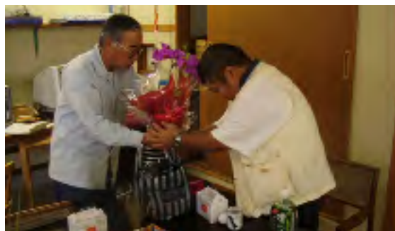
第2回誕生日会好きなもの をもらい満面の笑み！ おめでとーございます。