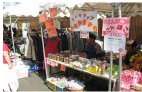
おおやまみちの出店風景

おおやまみちでは自主製品を販売しました。お客様がたくさんご来場していただき、まつりを盛り上げてくれました。