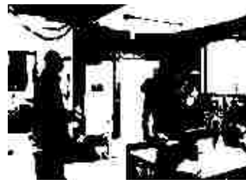
職員のOさんが鬼になりました

2月3日は、節分です。今年の節分は、日曜日だったために2月1日(金)に皆で、節分の豆まきを行いました。「鬼は外、福は内」(災いをもたらす鬼は家の外へ、幸福をもたらす福の神は家の中へ)と、その節分のかけ声通りに、今年も一年を幸せに過ごしたいです。