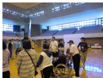
ゆるキャラジグソー

今年度は厚木市の上荻野運動公園で行われました。県央地区(厚木市、座間市、大和市、伊勢原市)の施設27か所が参加し、400名を超える大会となりました。午前にはゆるキャラパズルを完成させるゲームやサイコロの出た目を当てるゲーム、パン食い競争とくじをミックスさせたゲームの3ゲームがあり、すべてに参加し楽しみました。休憩時には交流会にふさわしい、名刺交換ゲーム・魚釣りゲーム・お絵かきコーナーなどをして他の施設を交流する機会を持つことができました。午後には各事業所の紹介を知ってもらうためムービーショーが上映されました。