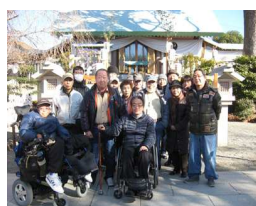
皆さんそろっての写真