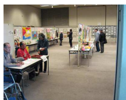
受付から見た会場

おおやまみちでも毎年普段製作している作品を出店していますが、他の施設では福祉展のために作っているようです。それぞれの違いがあったてよかったです。