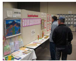
おおやまみちの作品