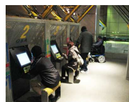
防災クイズを解答中