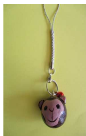
今年の干支のキーホルダー