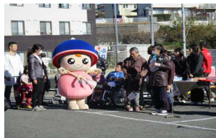
伊勢原のアイドル!?登場

昨年12月の「ふれあい福祉まつり」は風もなく穏やかな天気の中で行われました。いつも来てくれる「くるりん」は受付付近でみてくれていました。午前中にたくさんの方たちが来て下さり、午後はまばらになり早めに終わりました。餅つきの体験もあり参加した人たちはいただきました。