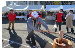
初餅つき体験！良い経験です