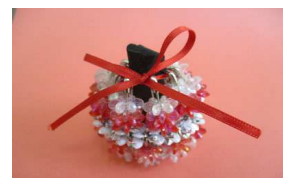
ビーズ小物 真中は消臭のできる炭