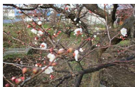
例年よりも1週間早い開花です

おまつりは2月27日(土) 11時から14時までです。受付で食券を買いそれぞれのお店の味を楽しんで、催し物は福祉施設の自主製品販売、竹トンボ体験等を計画しているので、皆様お誘いあわせの上お越し下さい。湯茶・甘酒は無料サービスです。