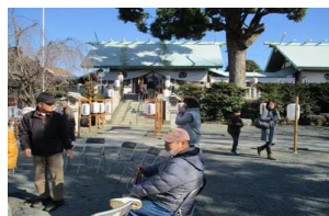
今年は何を願おうか～??