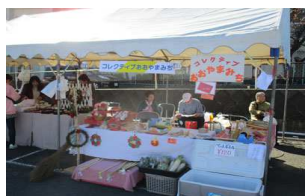
忙しさも一段落でした