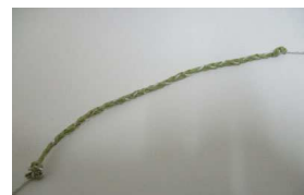
イグサで作ったミサンガ