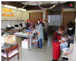
屋台の準備も大詰めです

今年も2月27日(土)に梅まつりを開催しました。2003年から始まり14回目になりました。お天気にも恵まれていつもの年は準備に追われてドタバタしていましたが、今回は前日もお天気がよく事前にたっぷり用意が出来たので慌てずにできました。気温も暖かく風もなく穏やかで来客もいつもよりは早く来て下さり、始まる時間