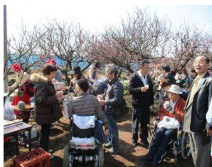
大変賑わって見通せないです

分ほど早まりました。受付もピーク時は混雑して大変でしたが、うれしい悲鳴です。肝心の梅の花ですが、今年は暖かく年明け早々に咲いてしまったのもあり心配でした。でも当日に見ごろのものや、まだつぼみの