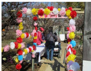
受け付け開始が早まりました

ものなどいろいろな花がありました。催し物では口笛演奏、バンド演奏などをして下さり、来客も歌ったり手拍子で喜んで頂きました。屋台は焼きそば、焼き鳥