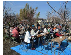
催し物を楽しみながら食事