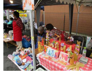
2日間でたくさんの方にご購入頂きました。

10月1日(土)、2日(日)に恒例の道漕祭り出店をしました。ここ数年は天候が悪い時もあり雨が心配でしたが、今年はその心配もなく沢山の人たちで賑わいました。出店場所が人通りの多い場所でしたのでお客さんも見に来てくれました。両日ともに特に人気だったのがストローで回すコマのおもちやで購入後にすぐ遊ぶ子もいました。最後までいることはできませんでしたが帰る際はより人が多く自宅に着くまで大変苦労しました。