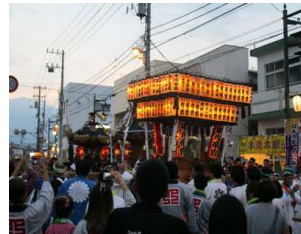
神輿は盛り上がりました