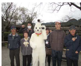
にゃんまげと記念写真

2日目は日光江戸村へGO!!! 開門時間に行くことが出来たので侍のお出迎えをされながらの入門に得した気分。江戸村内では様々なイベントを行っていましたが、今回は演劇と水芸の見学。初めて見たものだったので新鮮さ抜群。イベント終了後にはおひねりをみんなでステージ上に投げました。天候不良によりすべてを見学できませんでしたが、少しの時間でも十分満足できる場所でした。帰りは道の駅で食事とお土産を購入。楽しい旅行も無事に終了しました。