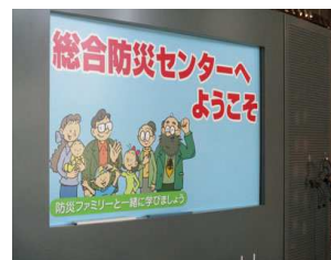
防災センター入口

毎年恒例になっている防災センター見学をしてきました。当日はお天気も良く外出にはいい日でした。センターに着いたときに外では消防士さんが訓練をしていました。いろいろな体験をする前に災害説明の上映を見て順番に体験をしました。始めに地震体験です。起震できる部屋に入り震度7までの横揺れで関東大震災と同じ揺れの体験です。電動車いすは倒れませんが縦揺れも加わるとどうなるかわかりません。