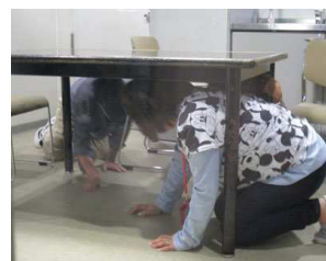
大地震の時の対処

次に煙の中の避難体験です。建物の中を煙で充満している中を脱出できるかです。体験している人たちを外にいる人がどのように逃げるかが壁のパネルを見てわかります。