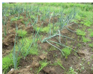
長ネギとコスモスの苗

毎年加工品として作ってきた梅干しや梅ジャム等は作れなくなりましたが野菜や花の栽培に力を入れ始めました。またさつま芋やほうき草、その他の植物の株分け、野菜の間引きなど、これから夏に向けて収穫や花を咲かせたりで忙しくなります。