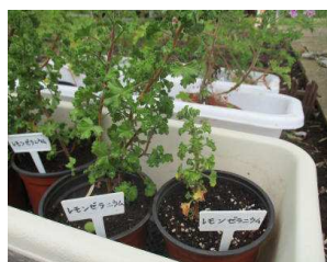
レモンゼラニウムの苗

夏になると雑草も多く生えてくるので6月からは週に1回全員で草取りを始めます。またツルのある植物で緑のカーテンを作ったり、ハーブの植物で虫除けなどにもします。その一つのレモンゼラニウムは代表的な高山植物のひとつでピンク色の花