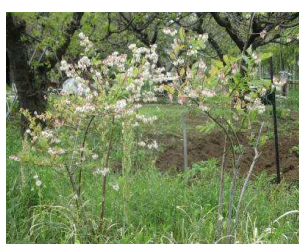
ブルーベリーの花

毎年加工品として作ってきた梅干しや梅ジャム等は作れなくなりましたが野菜や花の栽培に力を入れ始めました。またさつま芋やほうき草、その他の植物の株分け、野菜の間引きなど、これから夏に向けて収穫や花を咲かせたりで忙しくなります。