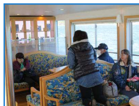
山中湖からの絶景はまた行きたくなるような素晴らしい景色でした。

最後に忍野八海で紅葉に囲まれながらの散策。あと1週間遅く来ていたら、紅葉がもっときれいになっていたなと思いました。今回は日帰りの為、あっという間に時間が過ぎてしまいましたが、またいつか紅葉シーズンに行ければなと思うような素敵な旅行でした。