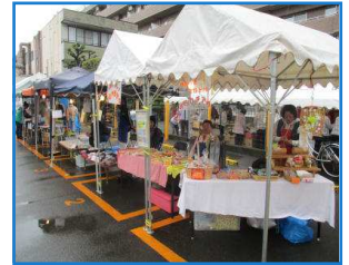
出店時は雨模様(涙)!!

伊勢原市で有名なイベント「道灌祭り」が10月14日(土)～15日(日)2日間で開催されました。両日ともにあいにくの天気だった為、中止するイベント等がありましたが、「信州諏訪御柱里曳き」や「太田道灌公鷹狩り行列・北条政子日向薬師参詣行列」などは予定通り行われ、周辺にはたくさんの方がいました。