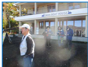
山中湖到着後すぐに遊覧船へ乗船。

前日までの大きな台風が過ぎ去り、天気も無事に快晴の状態です。山梨へ出発進行～～！！最初の目的地は山中湖。到着後、車から降りると強風の影響により寒さが倍増。(涙)そんな寒さにも負けず湖畔にはたくさんの鯉と2羽の白鳥がお出迎えがあり、目的の遊覧船に乗船。山中湖周辺の景色