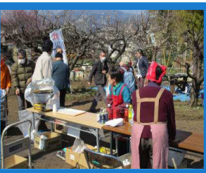
たくさん売れました