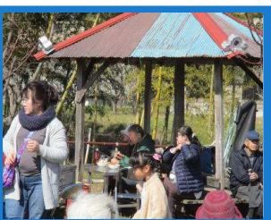
休憩所も大変賑わっていました。

ぺんにたくさんの方々が来てくださいましたが、今年は少し違い、途切れなく次々と来ていただきました。2月13日(水)におおやまみちの近隣へポスティングもしたので、そのビラを見てきてくれた方もいました。また、自主製品の販売としてねくすと、つくし、ドリームの方たちも出店をしてくださり盛況でした。催し物は口笛の曲で歌詞の紙も配られ、会場にいる人たち全員で合唱もしました。1時を過ぎると人もまばらになり静かになってきたので、片づけを始め1時間ぐらいできれいになりました。その後、室内にボランティアのご協力のお礼のあとに記念写真をとって解散しました。今年は梅の花は全体では少し早かったようですが、お天気の心配もなくよかったです。