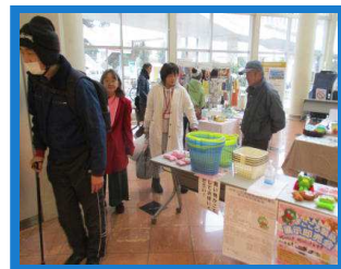
数百種類ある製品を楽しんで見れました

今年おおやまみちではみんなで販売会を見学。当日はお客さんで販売したフロアはいっぱい賑わっていました。市内施設の自主製品は市役所出店等で見た事がありましたが市外の製品を見るのは今回が初めて。各市内のゆるキャラを使用した製品や施設で独自で作成した製品などすべてが新鮮で楽しめました。来年も見学出来たらしたいです。