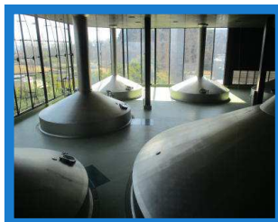
ビールタンク、ジョッキ何倍分?

時間がなかったのアサヒビール工場を堪能する事が出来ました。また来たいです。帰りには小田原の鈴廣のかまぼこでお土産購入タイムとても充実した楽しいレクリエーションでした。