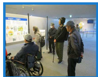
係りの方の説明を聞いています。

目が回りそうなくらい早い製造工程を見学することが出来ました。また足柄工場は環境問題にも取り組んでおり自社の制服等リサイクル品を使用して作っているそうです。すべての説明が終わるとお楽しみの試飲タイム。足柄工場で製造しているビール(スーパードライ・スーパードライブラック)やアルコールが飲めない方にもアサヒ飲料が(炭酸やオレンジジュース等)のサービスがあります。見学が終わると園内にある食事処へ。これまた豪華な食事を頂きごちそうさまでした。(写真はないのであしからず...)