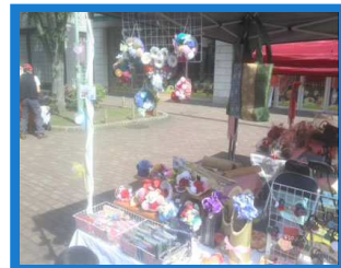
当日はお天気も良く賑わいました

毎月第2週土曜日に開催される、相模国分寺手作りフリーマーケットに参加しています。早いもので出店に参加してから早1年が経ちました。出店当初は品物が売れず悪戦苦闘でしたが最近はお店する度に目標売上を達成するようになったので今年度も頑張っていきます。フリーマーケットでしか出していない「おおやまみち」の製品が見れるかもしれません。お時間がある方は是非お立ち寄りください。