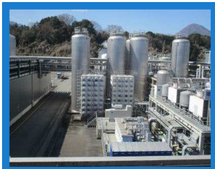
アサヒビール工場

今回のレクリエーションは足柄にあるアサヒビール工場への見学です。園内に入ると日本一の敷地面積を誇るアサヒビール足柄工場はたくさんの緑がありました。ロケーションは最高!!早速工場内へお邪魔しました。今回の見学は90分コースで一部