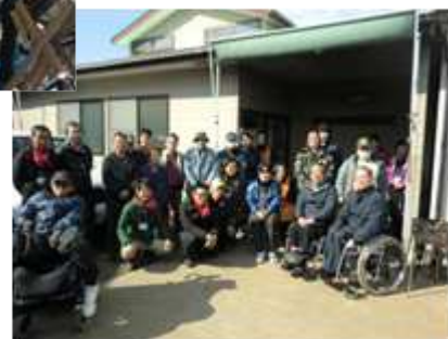
ボランティアさんとスタッフ